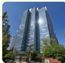
神保町三井ビルディング

〒101-0051 東京都千代田区神田神保町 1-105 神保町三井ビルディング 2階