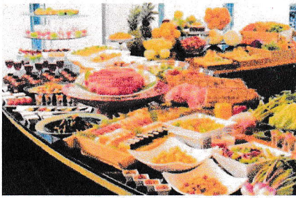
夕食バイキング(イメージ)