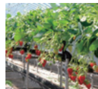
【高設栽培いちごイメージ】