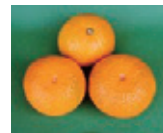
スイーツリング(イメージ)