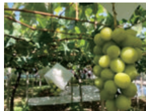
ぶどう狩り(イメージ)