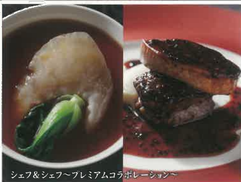
シェフ&シェフ〜プレミアムコラボレーション〜