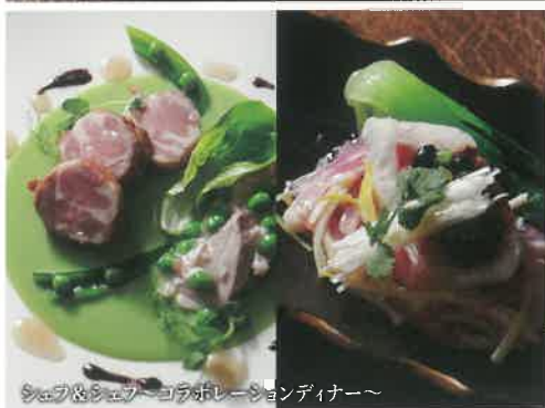
シェフ&シェフ〜コラボレーションディナー〜