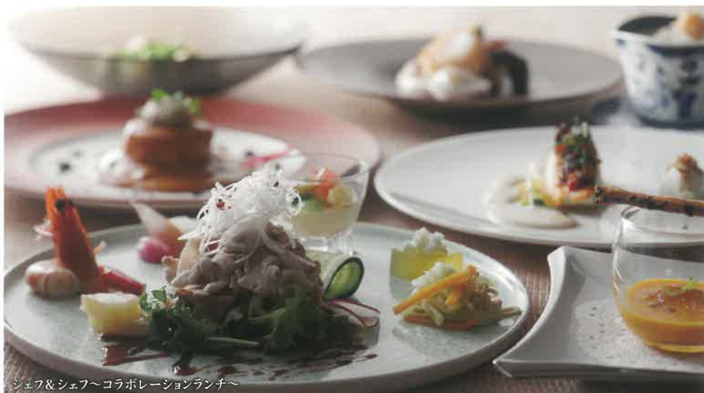
シェフ&シェフ〜コラボレーションランチ〜

ランチ 11:30~15:00 (Last Order 14:00) ディナー 17:00~21:00 (Last Order 20:00)