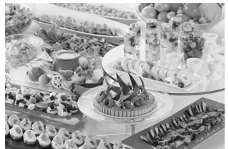
イメージ：アーティストカフェ