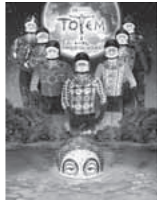
Photos: OSA Images, Matt Beard Costumes; Kym Barrett © 2010, 2014 Cirque du Soleil

◆申込方法 「トーテム」と記入し、希望日・券種・枚数を記入後7ページをご覧ください。